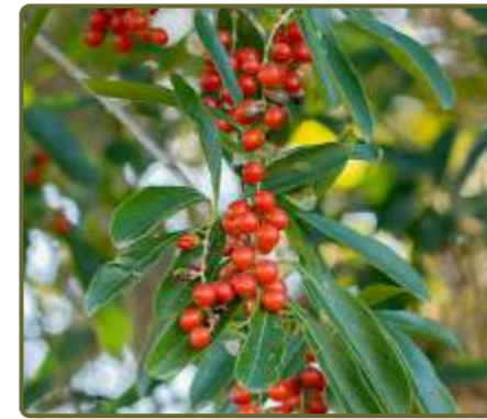
Citharexylum montevidense Tarumán