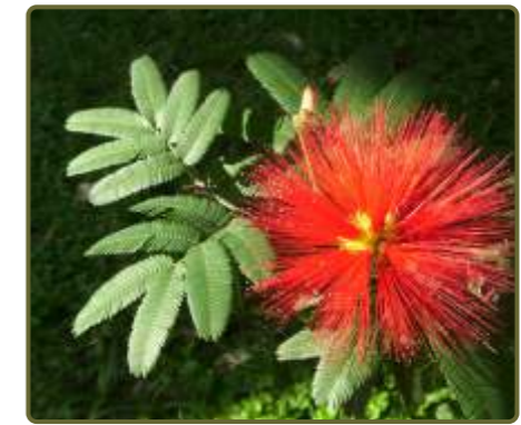
Calliandra tweedii Plumerillo rojo