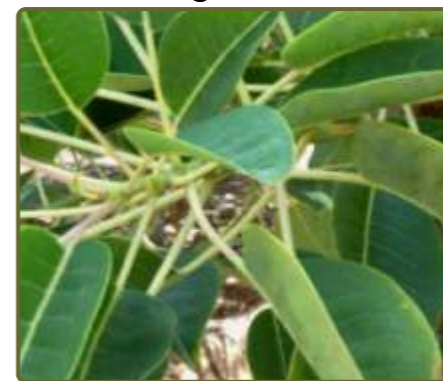
Phytolacca dioica Ombú