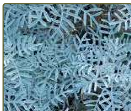
Senecio vira vira