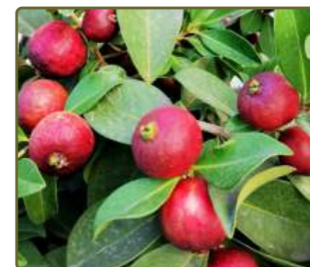
Psidium cattleianum Arazá