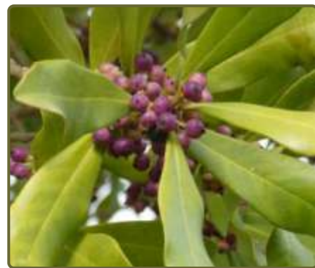
Myrsine laetevirens Canelón