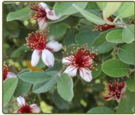
Acacia sellowiana Guayabo del país