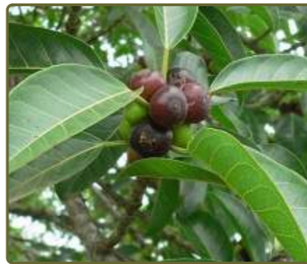
Ficus luschnathiana Higuerón