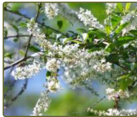
Aloysia gratissima Cedrón del monte