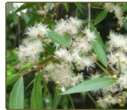
Blepharocalyx salicifolius Arrayán