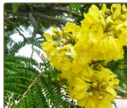
Peltophorum dubium Ibirapitá