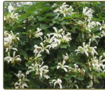
Bauhinia forficata Pata de vaca