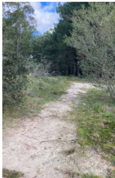
Se incorpora la caminería a la senda preexistente