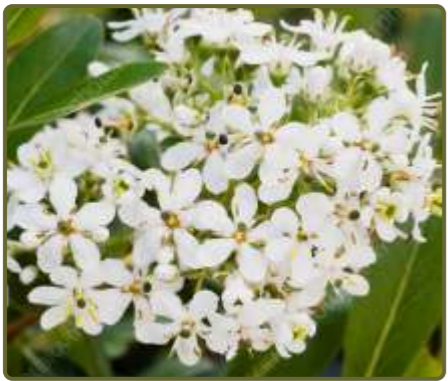
Escalonia bifida Pititos