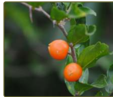
Celtis spinosa Tala trepador