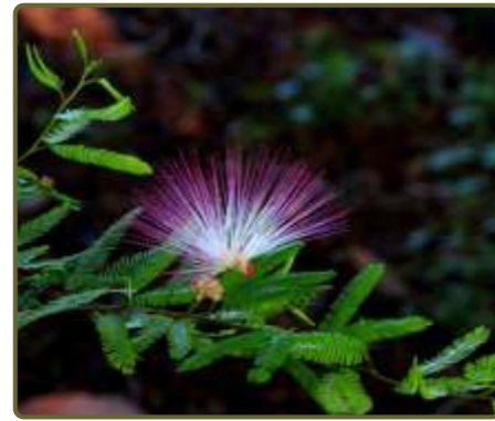
Calliandra brevipes Plumerillo rosado