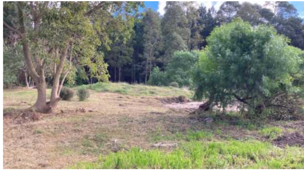
Hito simbólico - Jardín de herbáceas