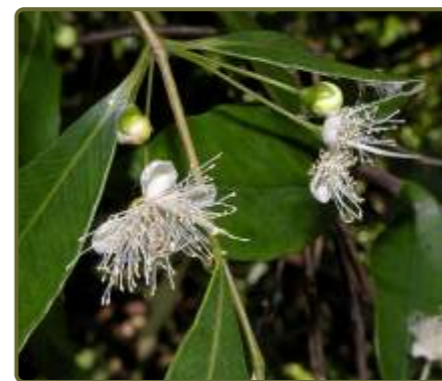
Myrceugenia glaucescens Murta