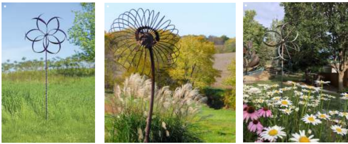
SIMBOLOGÍA / HITO