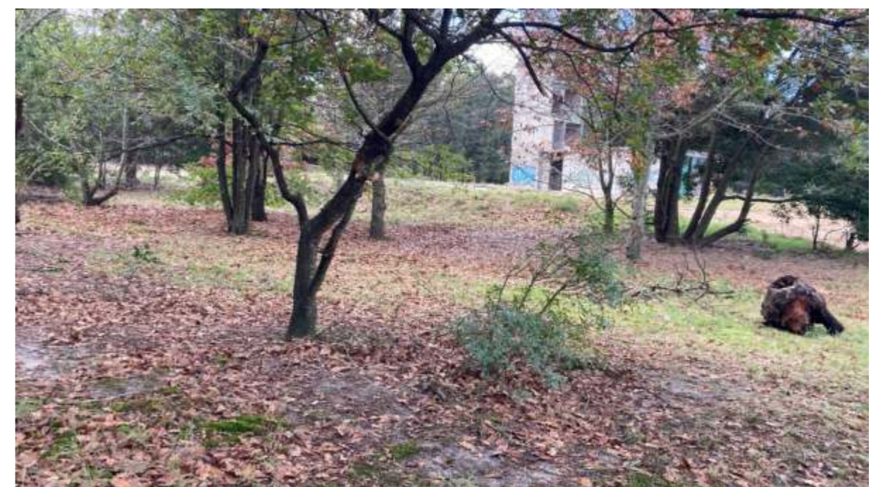
Refugio en el bosque (se bloqueará la visual mediante ejemplares vegetales)