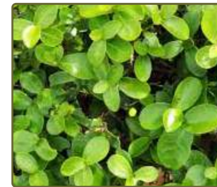
Daphnopsis racemosa Envira