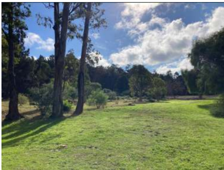
Acceso - ubicación cartelería