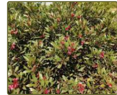
Dodonaea viscosa Candela