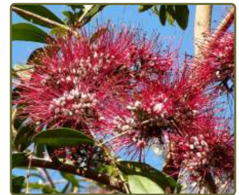
Myrrhinium atropurpureum Palo de hierro