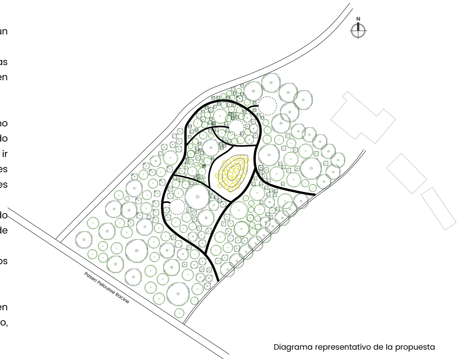
Diagrama representativo de la propuesta

“La propuesta busca generar un aporte a la conservación de la memoria colectiva y un homenaje a las víctimas mediante un aporte ecológico permanente.”*