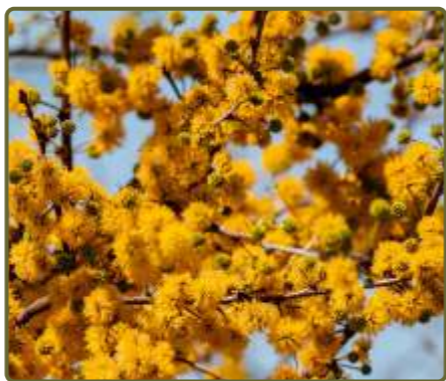
Vachellia caven Espinillo